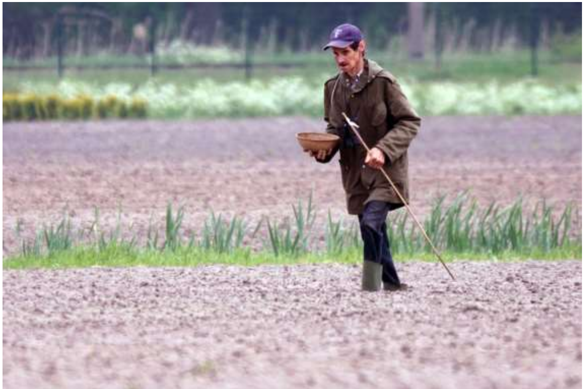
Frans mannen met het weghalen van mandjes en stokken.