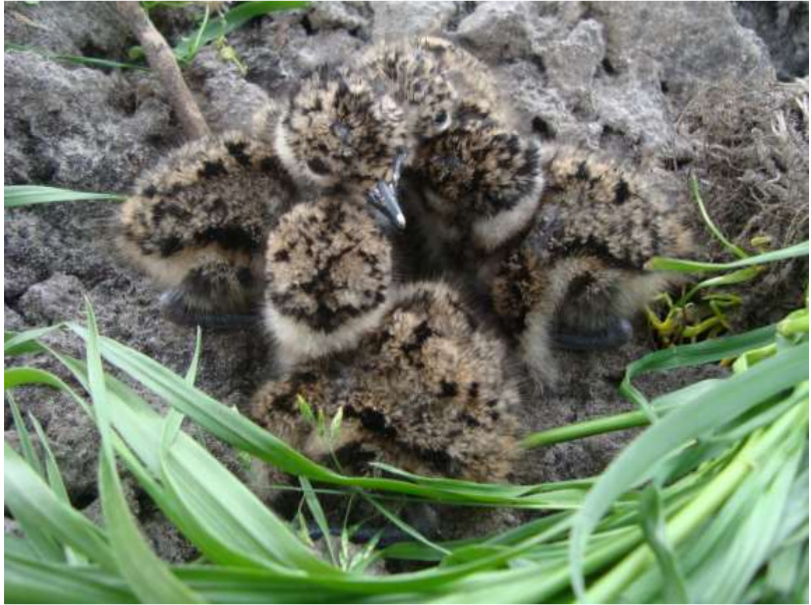
“Vier Pullen” zoals door Mikkie gefotografeerd op 29 april 2015

6-5-2015: \pm 14^\circ en droog. Op de Halvemaanweg zijn alle percelen “geteuld”. Veel nesten weg??? Volgende week goed observeren voor eventuele nieuwe nesten. Gespot: één gele kwik met takje in de bek, ergens aan het nestelen.